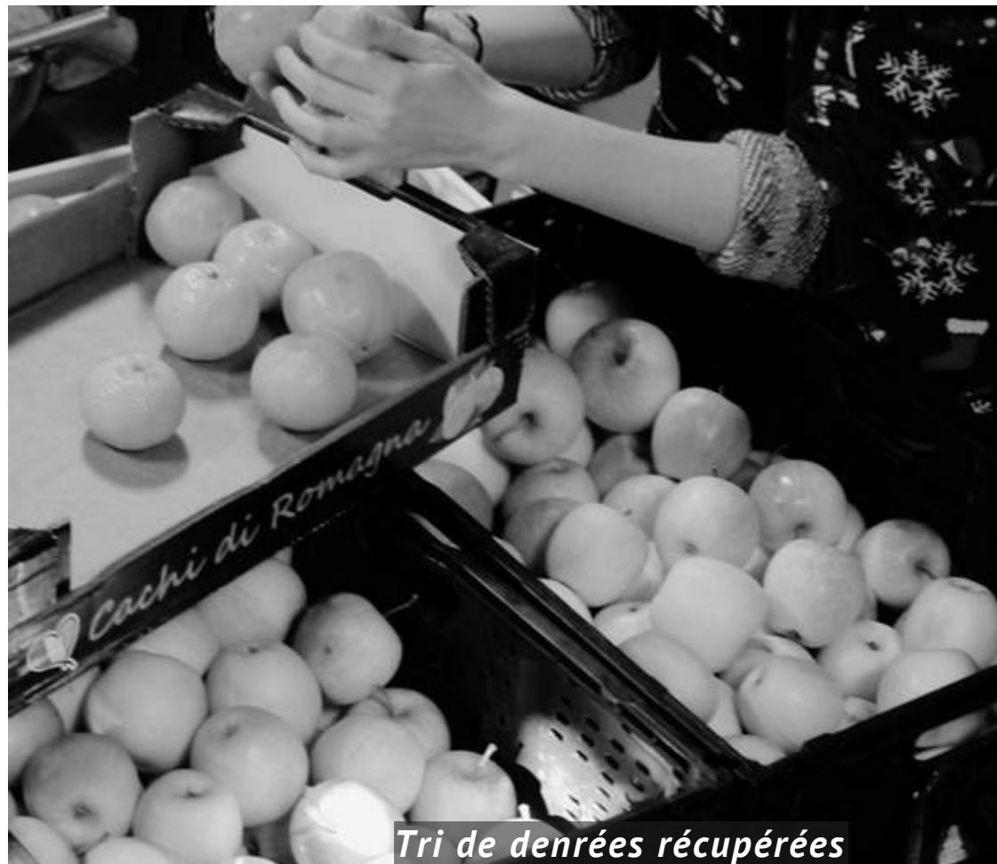
Tri de denrées récupérées