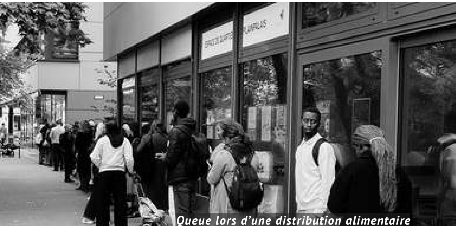
Queue lors d'une distribution alimentaire