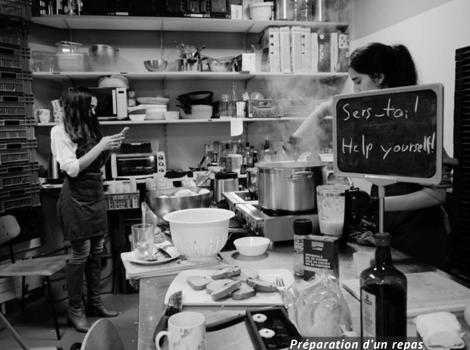
Préparation d'un repas