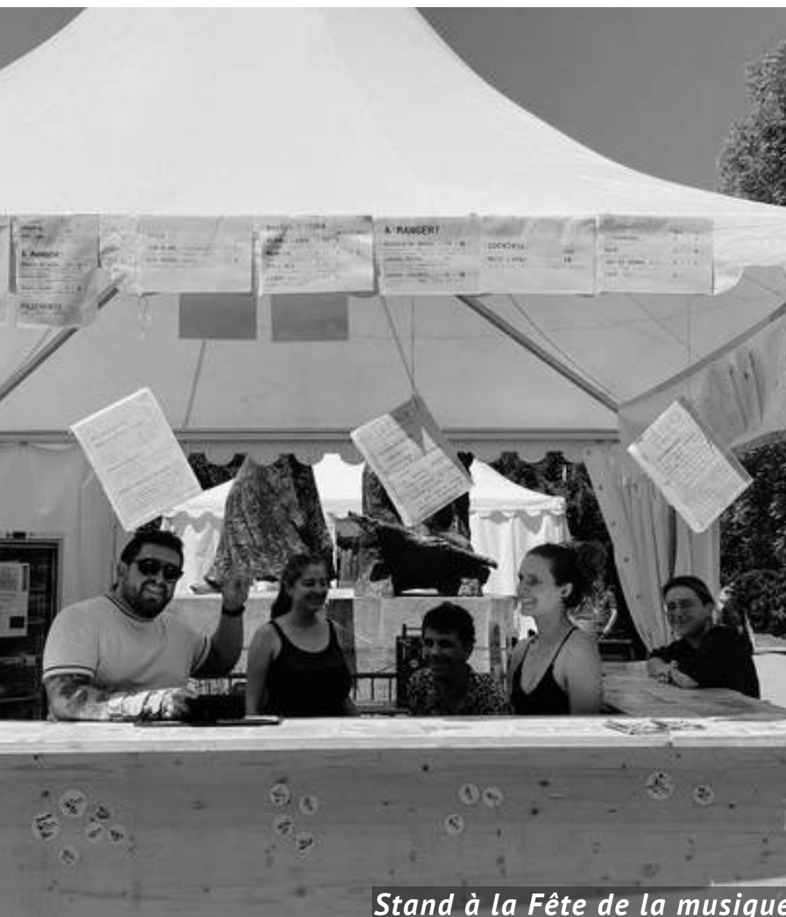
Stand à la Fête de la musique

L'association a pu faire rayonner son image lors de deux événements cette année: la Fête de la Musique et le Banquet Anti-gaspi. Notre participation à ces événements a, dans une logique de diversification des ressources, contribué au financement de nos activités tout en offrant aux bénévoles une expérience collective enrichissante.