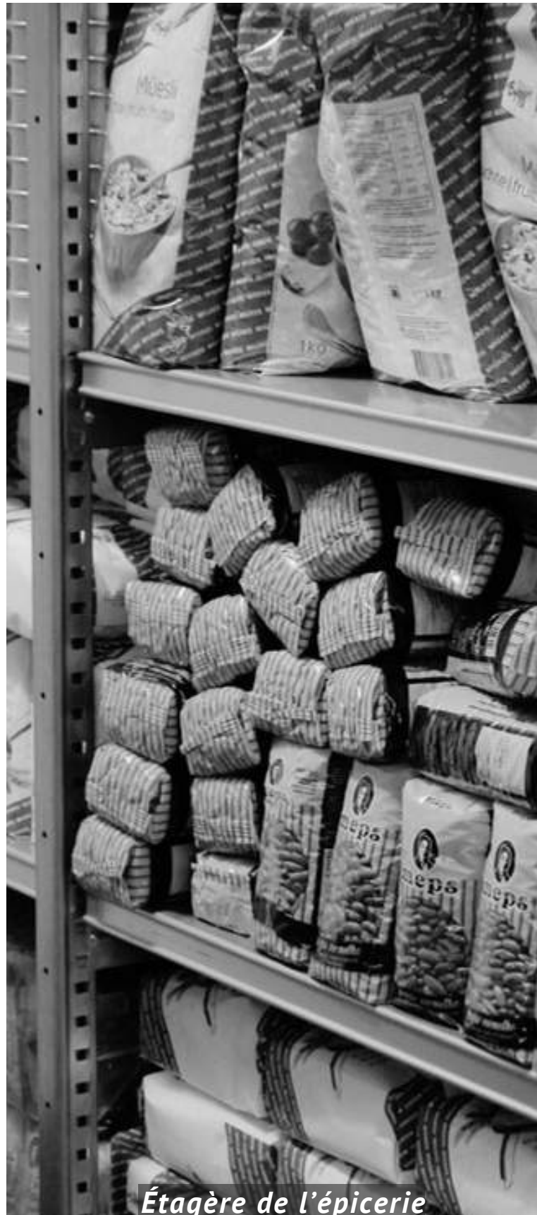
Étagère de l'épicerie

L'association veille à offrir un cadre respectueux et bienveillant lors de l'ensemble de ses activités, en particulier durant les distributions alimentaires.