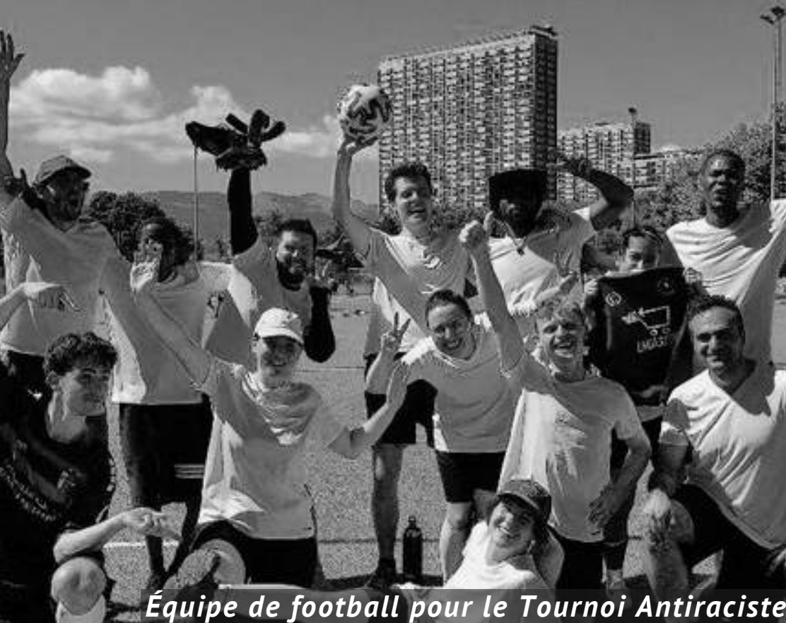
Équipe de football pour le Tournoi Antiraciste