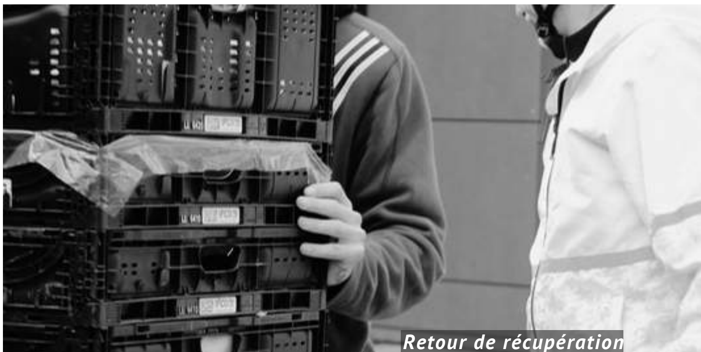
Retour de récupération

La Farce collabore avec différents partenaires agroalimentaires du canton afin de récupérer gratuitement des denrées alimentaires. Accompagné·e·x·s de bénévoles, les logisticien·nes effectuent les tournées de récupération à l'aide de vélos-cargos. Ce mode de transport écologique limite notre impact environnemental et favorise une participation inclusive, ne nécessitant pas de permis de conduire.