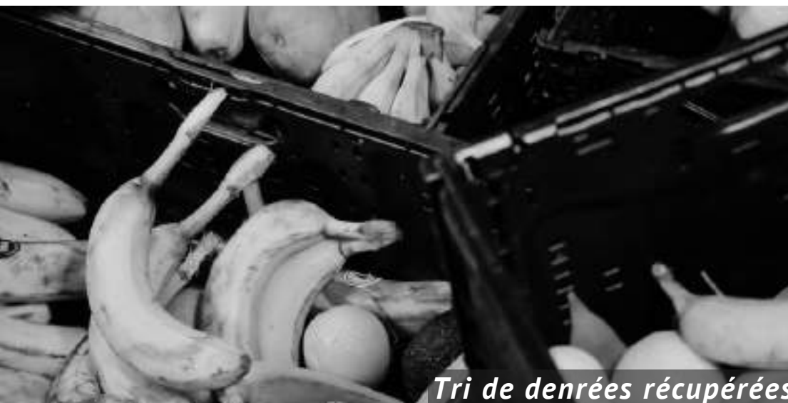
Tri de denrées récupérées