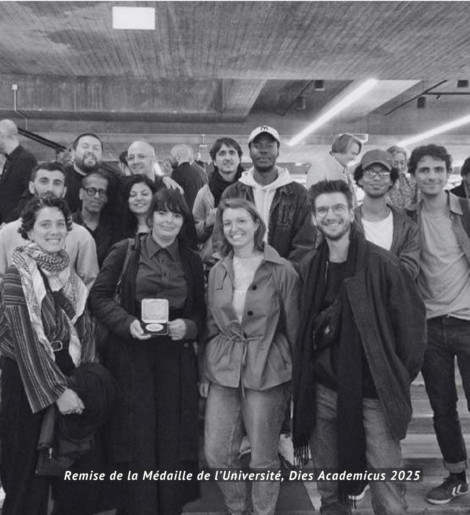
Remise de la Médaille de l'Université, Dies Academicus 2025

Merci pour l'opportunité et tout le travail que vous accomplissez!