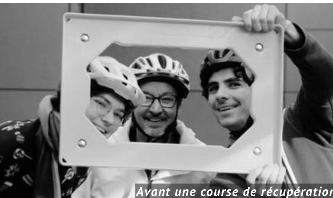
Avant une course de récupération