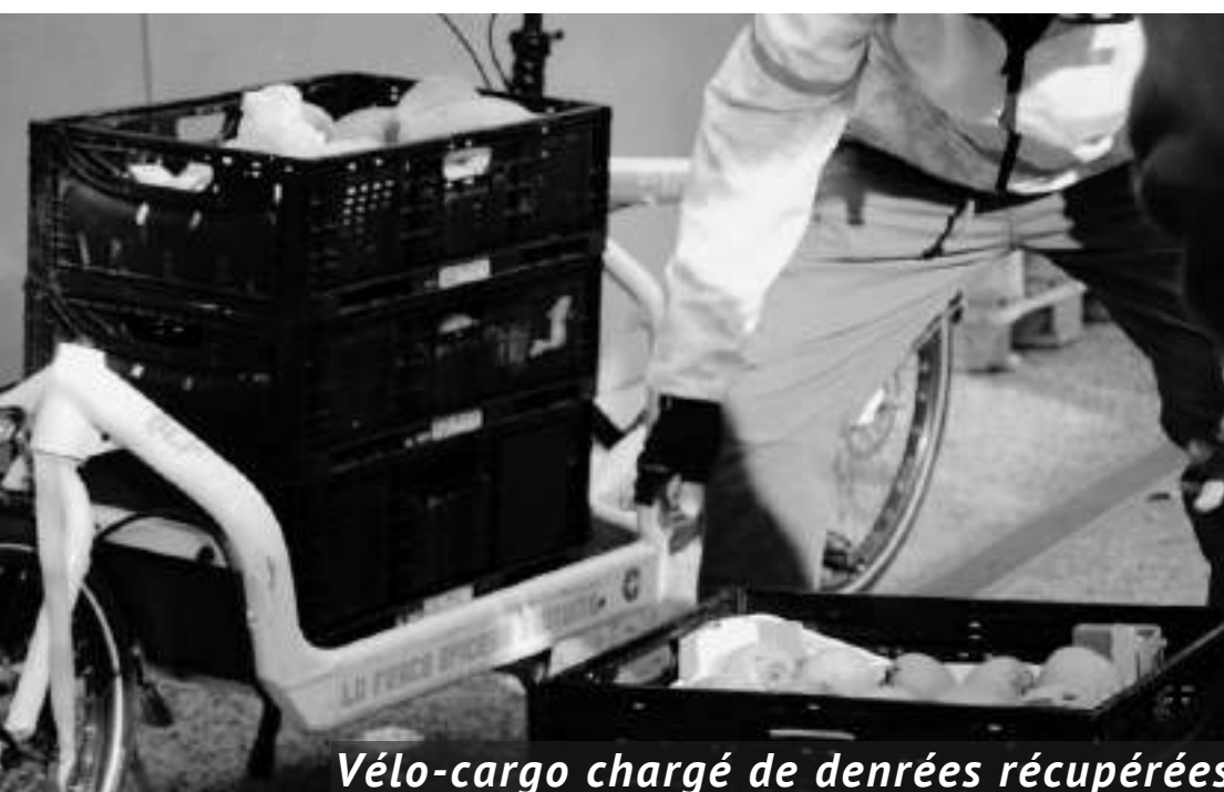
Vélo-cargo chargé de denrées récupérées

La Farce est un acteur significatif de la revalorisation alimentaire à Genève.