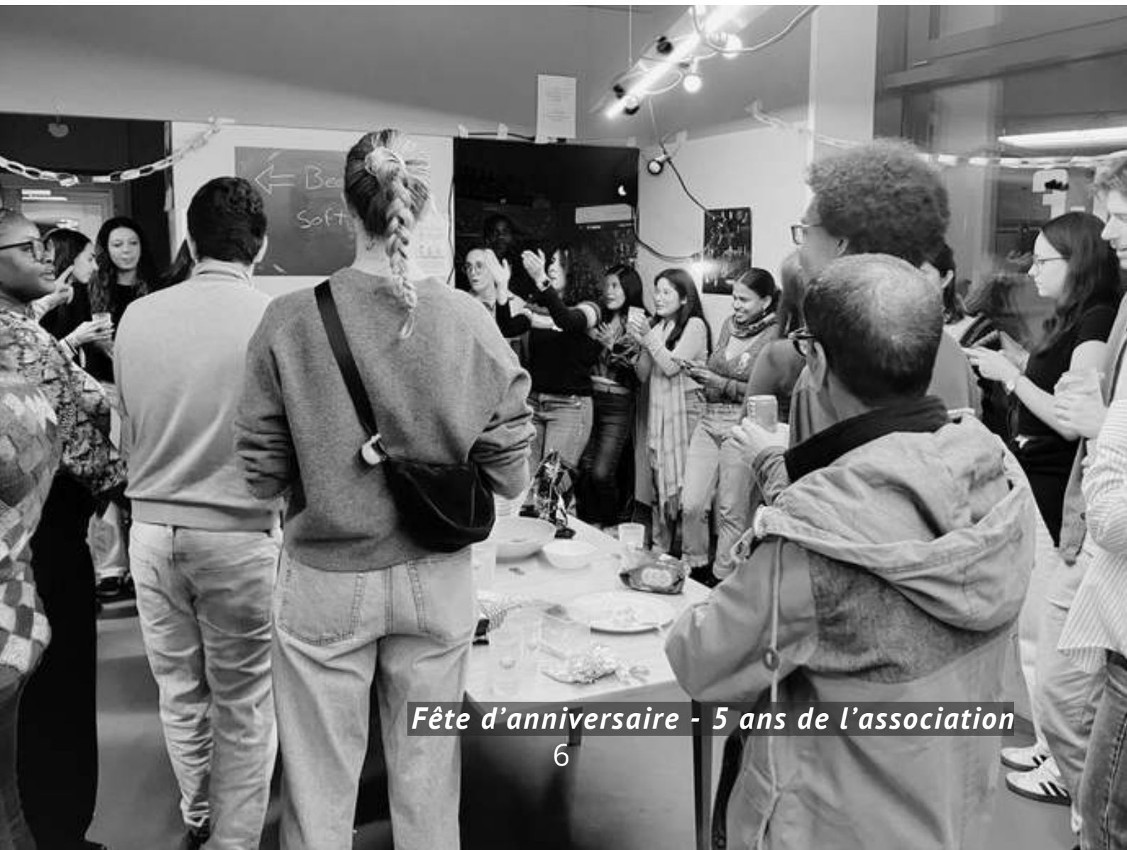
Fête d'anniversaire - 5 ans de l'association

La précarité estudiantine, souvent invisibilisée, fragilise les parcours académiques, la santé mentale des étudiant·e·x·s et l'égalité des chances. Pour y répondre concrètement, l'association a créé une épicerie gratuite destinée aux étudiant·e·x·s du tertiaire genevois.