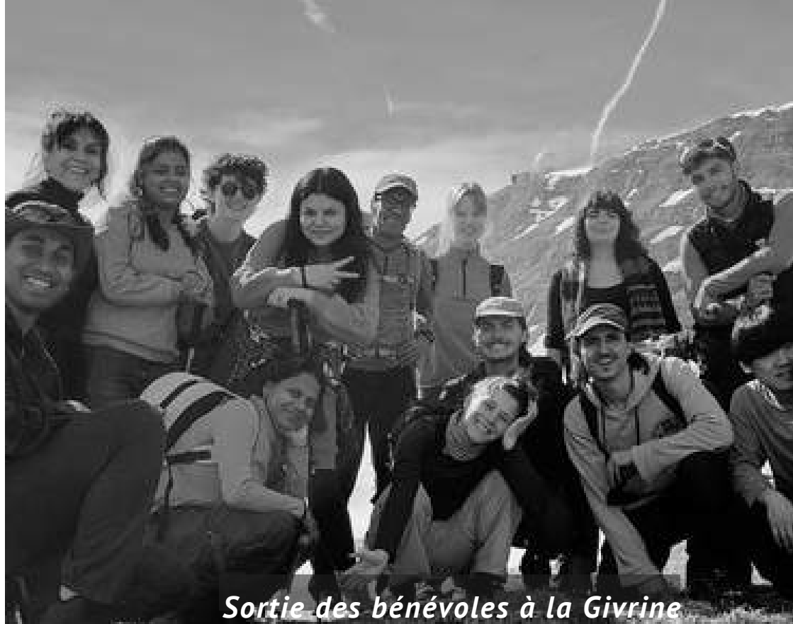
Sortie des bénévoles à la Givrine