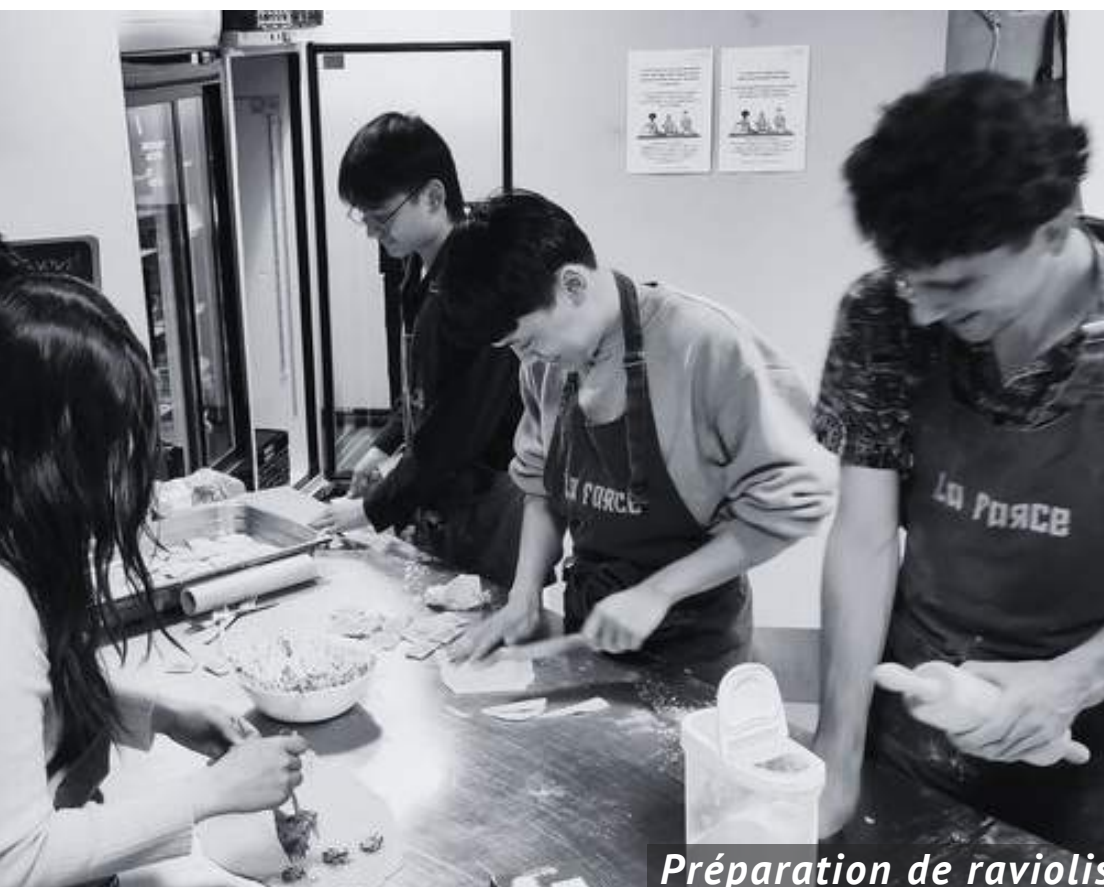
Préparation de raviolis

Située au 98 Rue de Carouge, l'arcade de l'association constitue un lieu inclusif et bienveillant, propice aux échanges. Elle accueille également des projets partageant des valeurs similaires, contribuant à une dynamique positive pour les étudiant·e·x·s, le quartier et ses habitant·e·x·s.