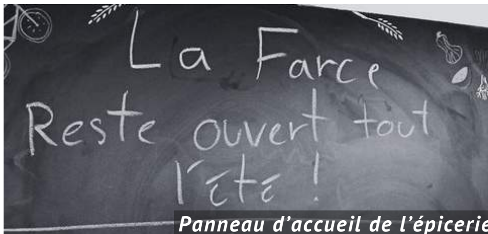
Panneau d'accueil de l'épicerie