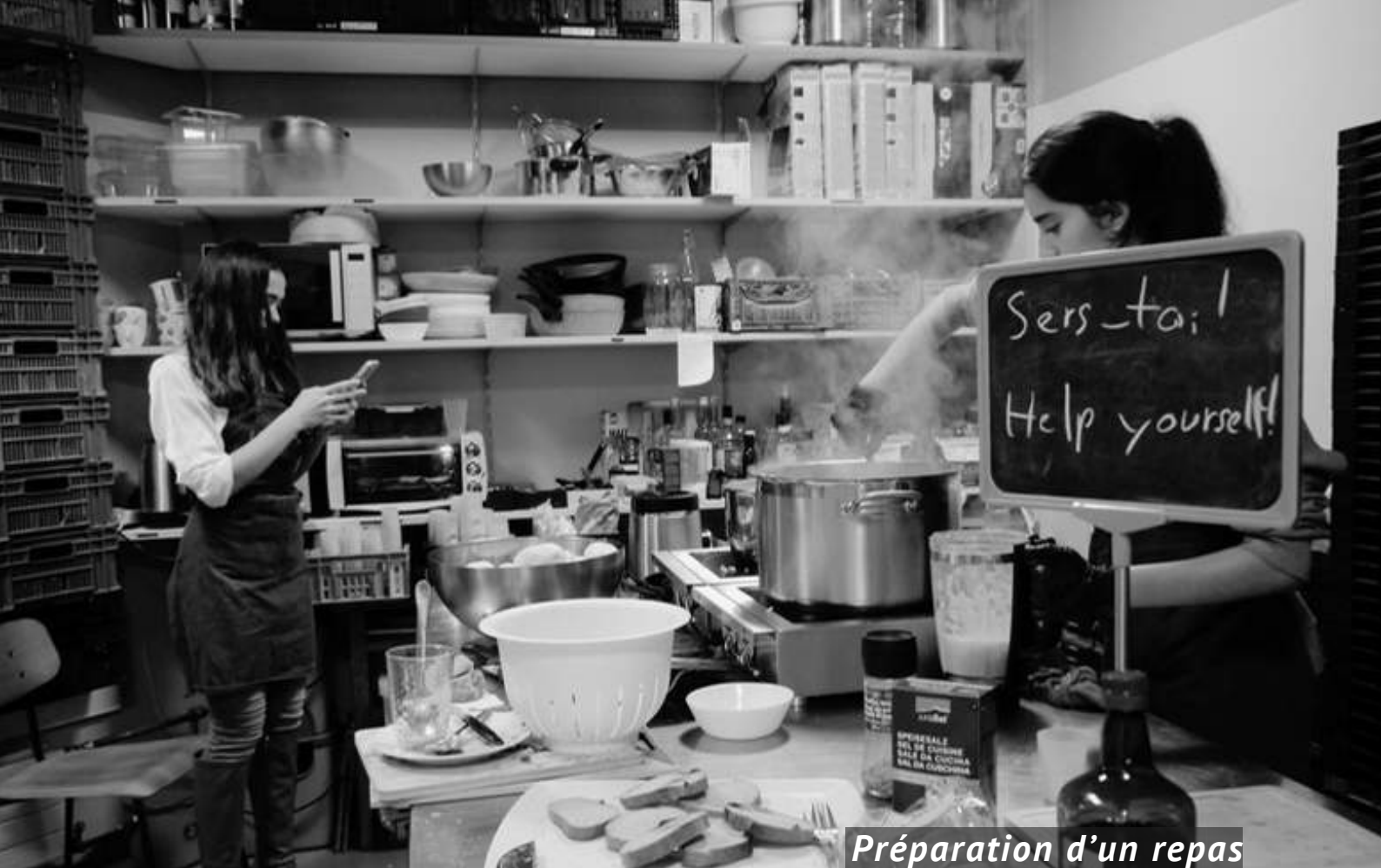
Préparation d'un repas