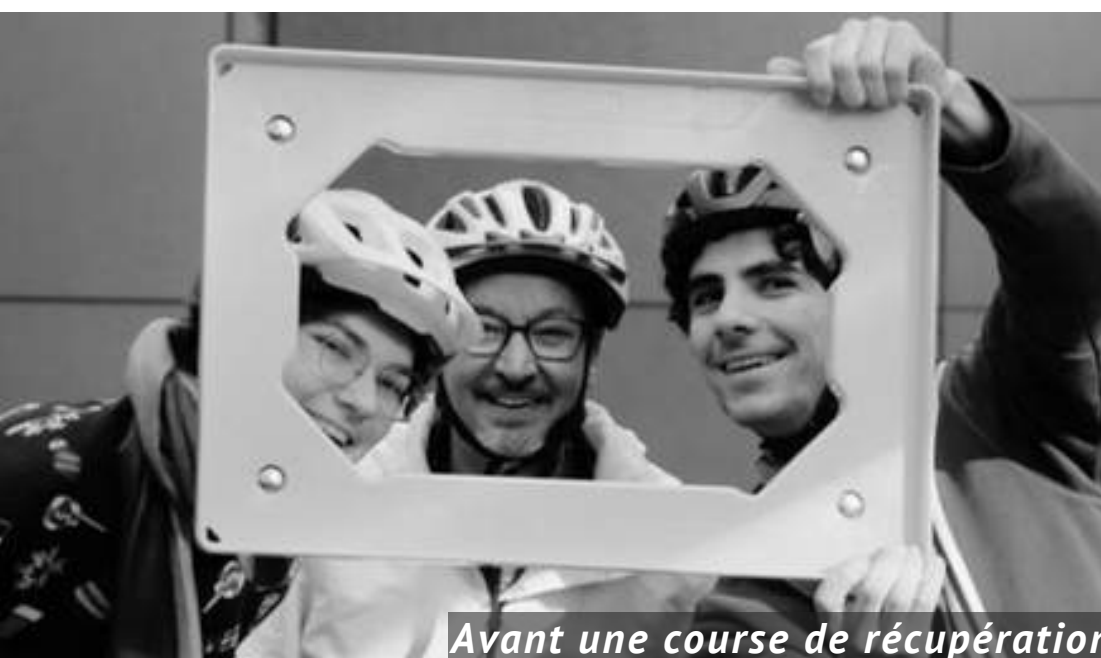
Avant une course de récupération