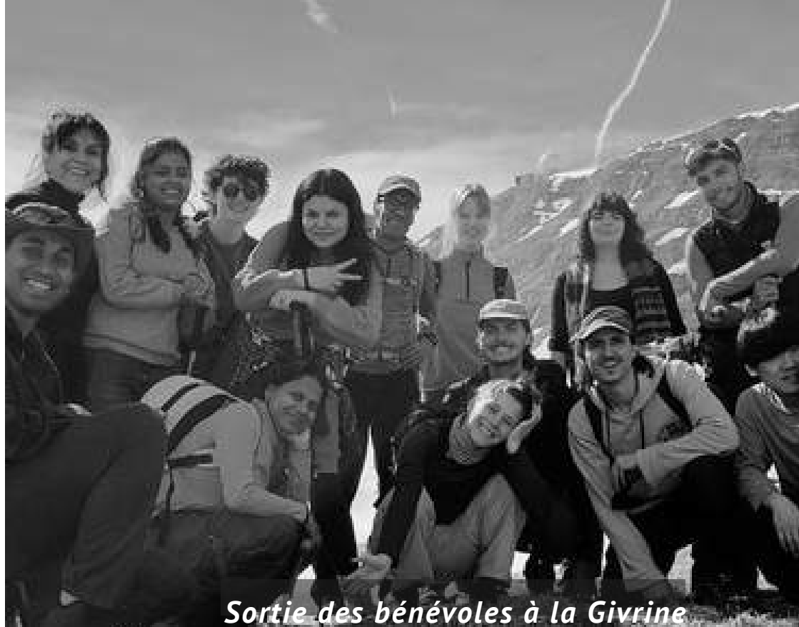
Sortie des bénévoles à la Givrine